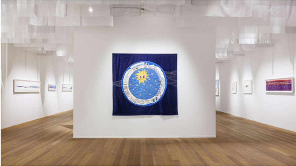
Britta Marakatt-Labba, Lodderáidaras – Melkeveien (Vintergatan), 2022 Foto: My Matson/Moderna Museet © Britta Marakatt-Labba/Bildupphovsrätt 2025 Bildupphovsrätt 2025

Utställning med guidning på Moderna museet