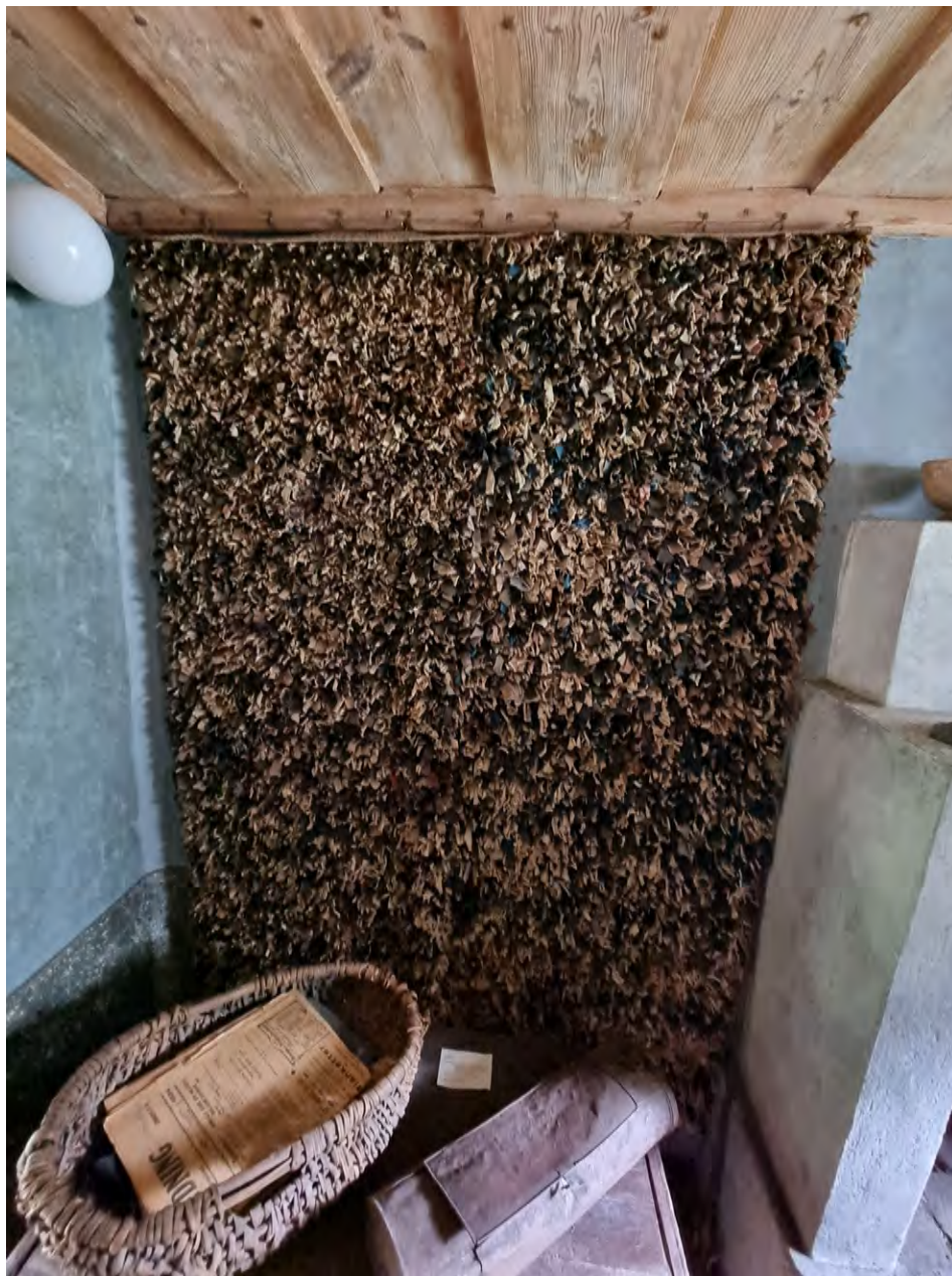
Trasrya från Kista Hembygdsgård. Vårens utflykt.