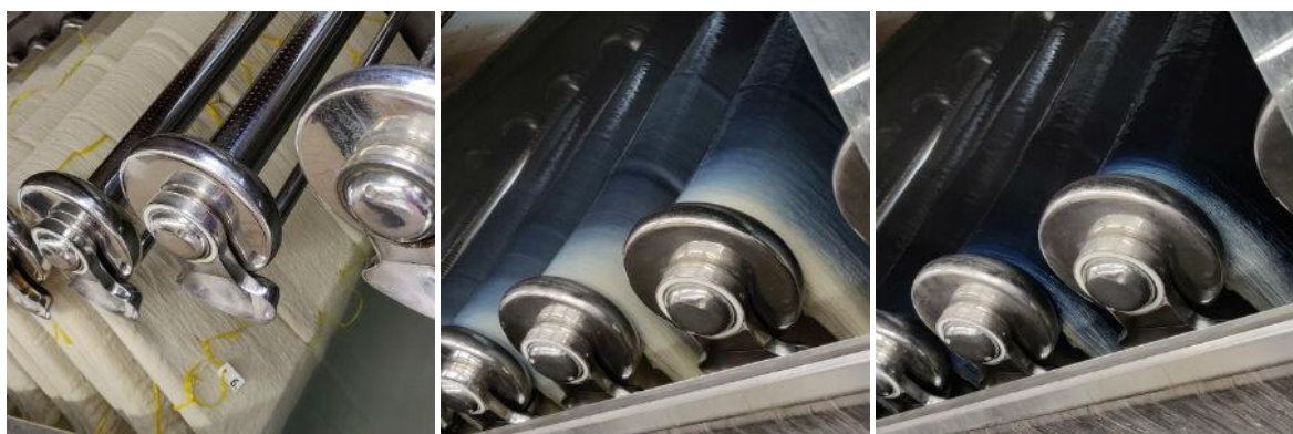
Färgnings maskiner med garn som ska färgas blå

Att färga garn är mycket kemi, exakt hur mycket färg och andra ämnen som behövs räknas noga ut i förhållande till garnmängd, kvalitet och vilken färg som ska färgas. Garnet måste oftast blekas först, för att färgen ska bli bra.