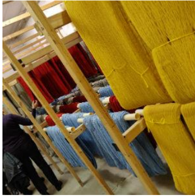
Garn på tork