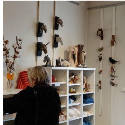
Vävkompaniets Butik Borås

Sen bar det av hemåt. Avslutat med ett lotteri, fina vinster inköpta i Vävkompaniet. Lotteriet var mycket uppskattat av medlemmarna på resan.