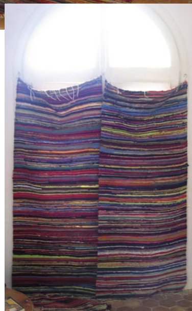
Draperi för fönstren – mot solen på dagen och kylan på natten

Vi bodde på ett koptiskt center, Anafora. En oas, inte bara i öknen, utan också i det tuffa samhället runt-