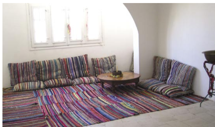
Sitthörnan i sällsrummet