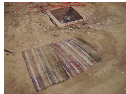
Den sista tjänsten