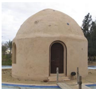
Det lilla kapellet utifrån – och inuti med trasmattor vackert utlagda.