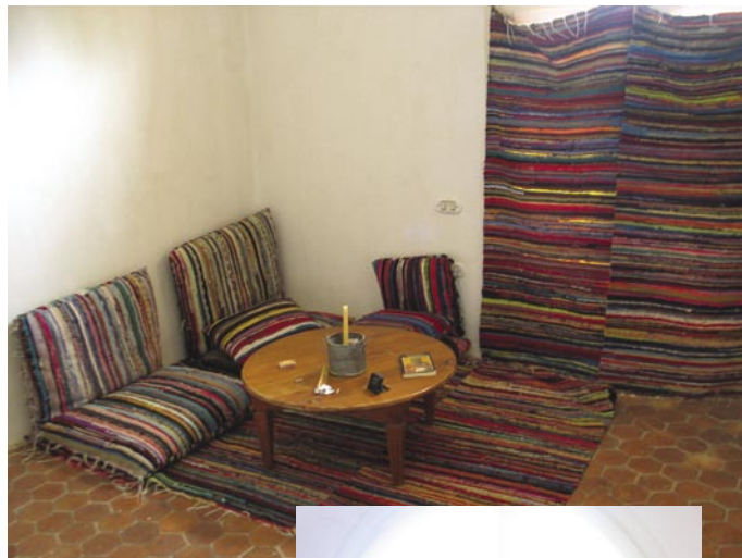
Vardagsrummet i vårt lilla hus.

skulle få vara med om, även om upplevelserna blev starkare än jag väntat. Men en sak hade jag ändå inte trott att jag skulle få se i Egypten - trasmattor.