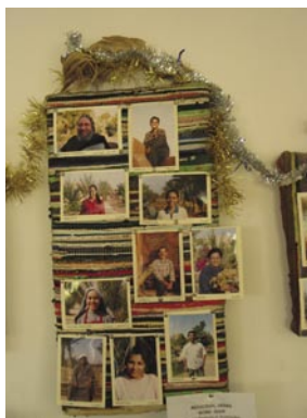
Anslagstavlan - gjord av en trasmatta naturligtvis